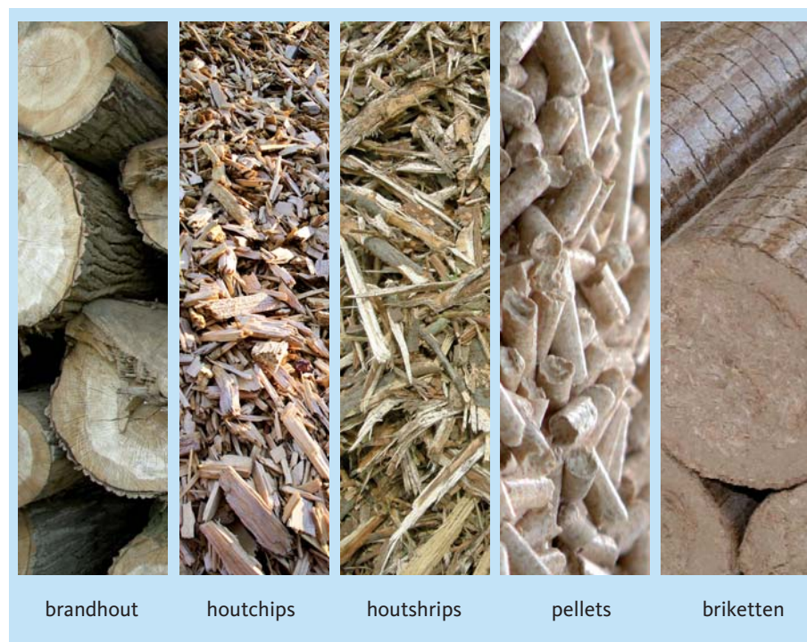
Figuur 4.1 Vijf categorieën houtbrandstoffen.

In zijn algemeenheid geldt dat de fysieke verschijningsvorm van een houtbrandstof bepalend is voor de gebruiksmogelijkheden. Of anders gezegd: de configuratie van de bio-energieinstallatie bepaalt welke voorbehandeling nodig is om van vers hout een voor die installatie geschikte brandstof te maken.