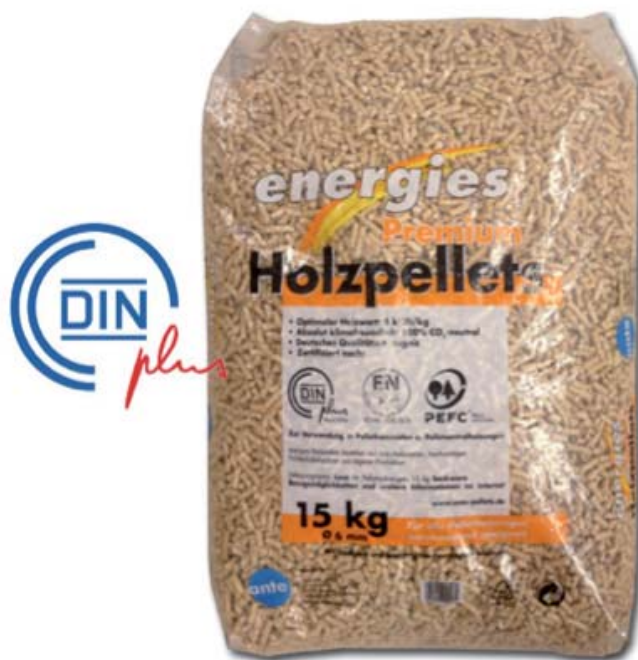
Figuur 3.1 Voorbeeld van brandstofkwaliteit (DIN systeem) op Duitse verpakking van houtpellets voor huishoudelijk gebruik.

De kwaliteitsborging van deze producten is vergaand doorgevoerd, vooral omdat hier sprake is van een consumentenmarkt en niet van een business-to-business markt. Hierbij spelen tevens aspecten als etikettering en consumentenvoorlichting een belangrijke rol, zoals blijkt uit onderstaand voorbeeld.