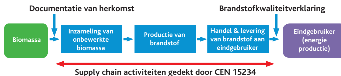
Figuur 6.1 Schematische weergave van de vaste brandstof supply chain (schema is bewerkte versie van schema in het normdocument EN 15234).

De houtbrandstof supply chain bestaat daarbij uit de verschillende elementen zoals in figuur 6.1 aangegeven