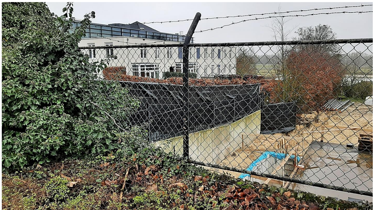
Oolgaardthuis bevindt zich zeer dichtbij de stookruimte van woongebouw 7.