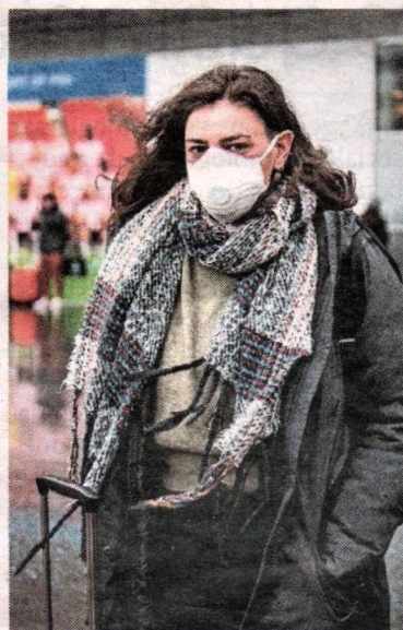
▲ Een vrouw met een mondkapje op het vliegveld van Eindhoven.

Volgens hem hadden regeringen lang geleden al chronische luchtverontreiniging moeten aanpakken. „Maar ze hebben de economie voorrang gegeven boven gezondheid. Als deze crisis voorbij is, moeten beleidsmakers de maatregelen versnellen om vuile voertuigen van onze wegen te krijgen. De wetenschap vertelt ons dat epidemieën zoals Covid-19 vaker zullen voorkomen. Schone lucht is dus een basisinvestering voor een gezondere toekomst.”